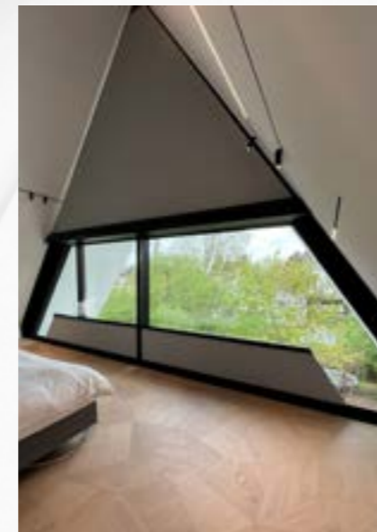
GJ - MW SERIES Pag. 7