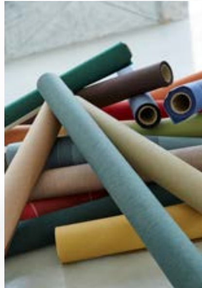
GJ - DOEKCOLLECTIES Pag. 3