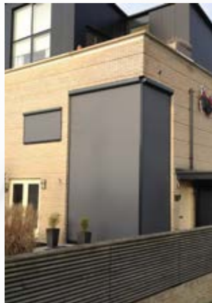
GJ - ZP SERIES Pag. 5