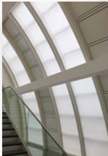
GJ - SZ SERIES Pag. 6