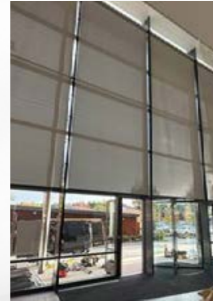
GJ - RB SERIES Pag.4